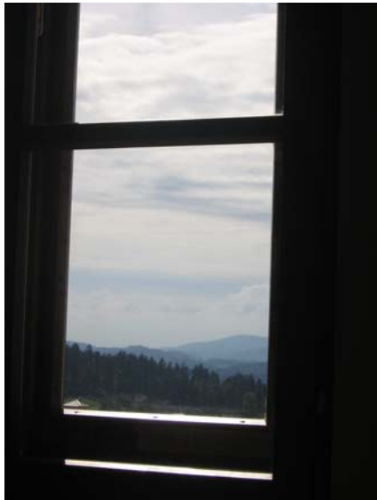
Blick aus der Heimatstube Schwarzenberg im Böhmerwald

Gegen Abend sind es nur wenige Schritte nach Bayern und gegen Mitternacht steigt die Landschaft noch weiter an bis sie schließlich sich zu jener geologischen Grenze und Wasserscheide auftürmt, die auch die Grenze zum tschechischen Südböhmen darstellt. Der Plöckensteinersee ist von hier aus ebenso erreichbar wie der Dreisesselberg nahe dem Dreiländereck. Im ersten Stockwerk des alten Schulhauses wurde eine dauerhafte Stifter-