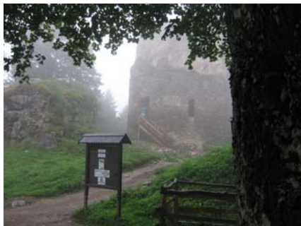
Vitkuv Hradek das „Witikohaus“

Ohne jede spektakuläre Heldentat geht Witiko mit seiner anscheinend auch für damalige Verhältnisse nicht gerade modischen Lederhaube an das Werk der Erhöhung des Lebens. Vor der Reise in den Böhmerwald, die ich - Stifterjahr sei Dank – im September 2005 unternahm wollte ich nur ein wenig auffrischen. Aber auch hier hatte ich meine Überlegungen ohne den listigen Adalbert gemacht. So ein bisschen reinlesen ging nicht! Es wurde ein völlig